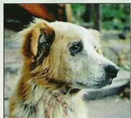
Willy 未食 Canidae 前