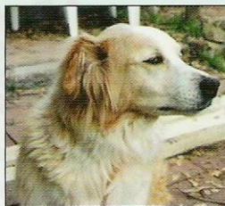
食用 Canidae 45 日後